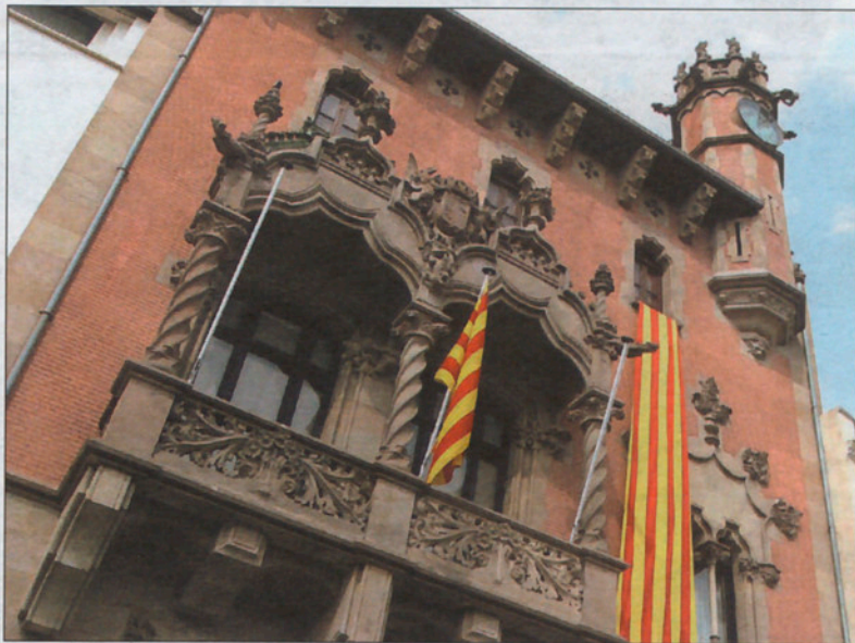
Tras el pacto PSC-ERC, desde hace tres años la bandera de España no ondea el Onze de Setembre en el Ayuntamiento de Granollers.