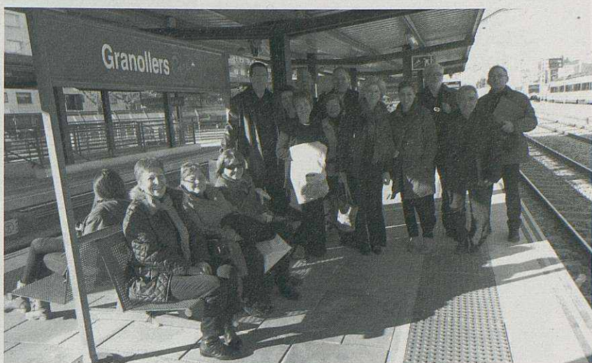
Representants de la coral a l'estació de Granollers

En el número anterior de la revista ja explicàvem que, juntament amb la Coral Amaranth de Bigues, estem preparant el viatge a Escòcia pel pont de Sant Joan, on oferirem dos concerts. El més important d'ells tindrà lloc a la Catedral d'Edimbourg on ja tenim dia i hora reservada per a la nostra actuació. Ara mateix tenim dues feines molt importants a fer: assajar molt i molt bé les cançons que hem