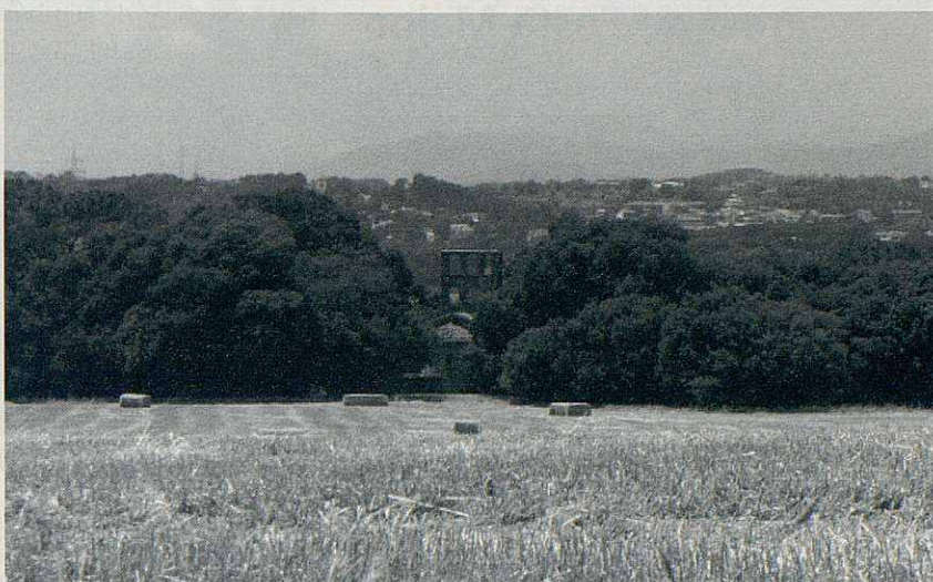
L'ermita de Santa Justa i el seu entorn.

Durant el mes de juliol la Biblioteca Ca l'Oliveres ofereix diverses activitats gratuïtes adreçades al públic infantil. Els dilluns 1, 8 i 15 de juliol, de 4 a 8 de la tarda, la sala infantil es converteix en un espai de jocs educatius, cooperatius, d'estratègia i de foment de la lectura per a passar-ho