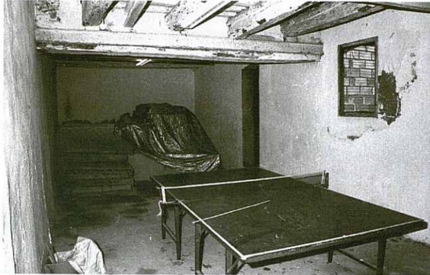
Aspecte actual de la planta baixa on s'ubicarà la futura sala d'exposicions de l'AEG.