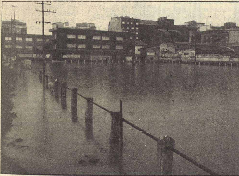
Las lluvias torrenciales caídas en el mes de noviembre se dejaron notar en nuestra población. La foto de J. Coma es un fiel reflejo.