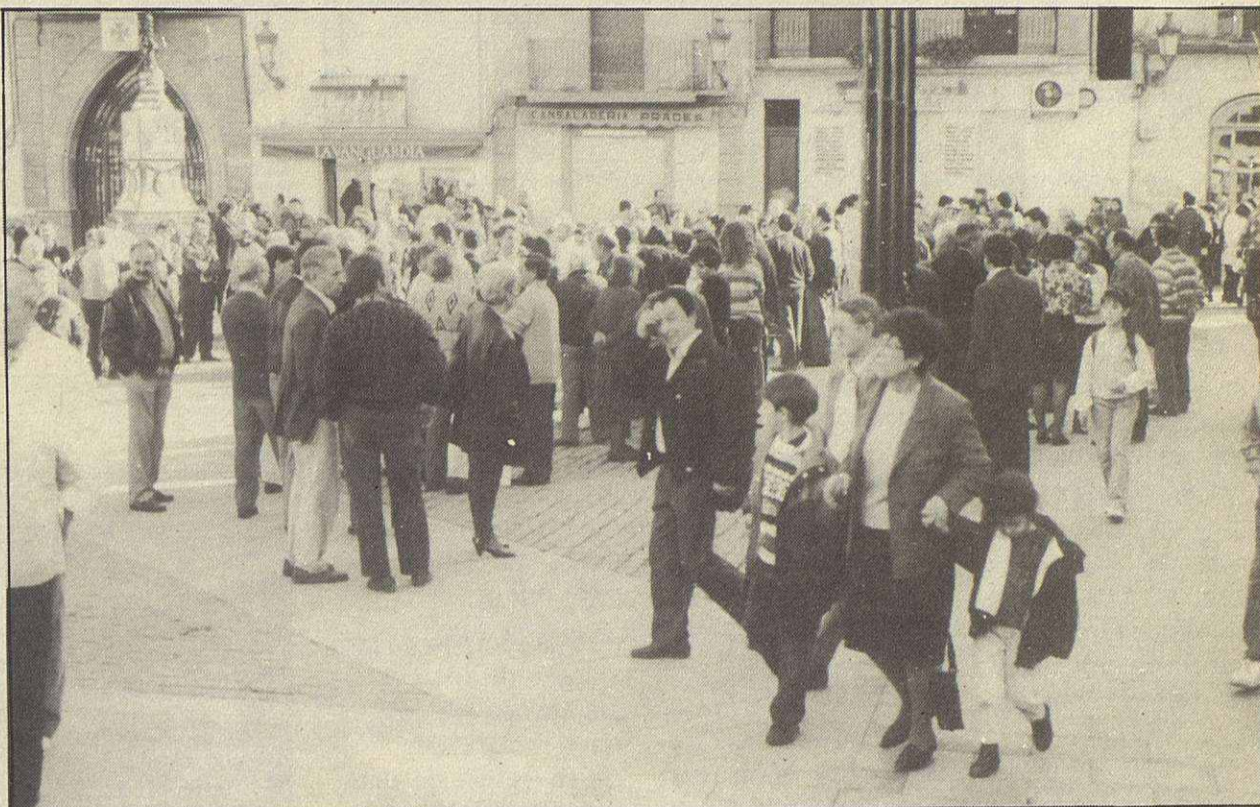
Los comerciantes nunca se habían manifestado como en esta ocasión