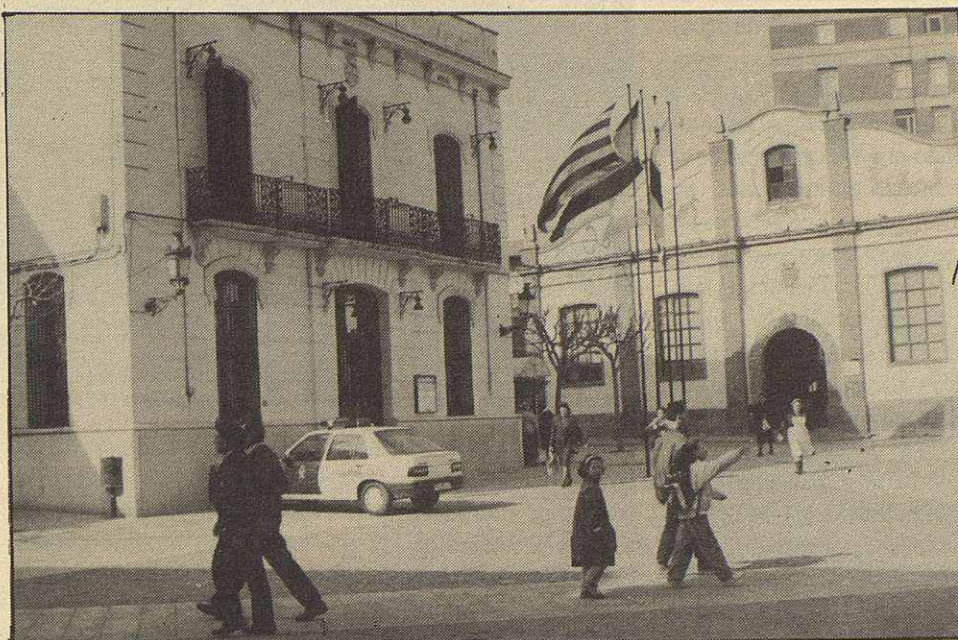
El Ayuntamiento necesita recaudar dinero con urgencia ante el despilfarro económico

Las multas se iban poniendo y la Diputación tenía, en teoría, la misión de cobrarlas siguiendo siempre el trámite legal-