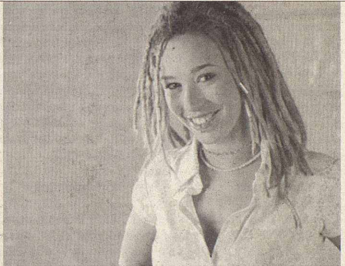
La cantante Beth será la encargada de realizar el pregón de este año

ciudad, acompañados por los castellers y capgrossos, realizarán el baile previo al pregón. La cantante Beth, concursante del programa Operación Triunfo y representante de España en Eurovisión, dará la salida →