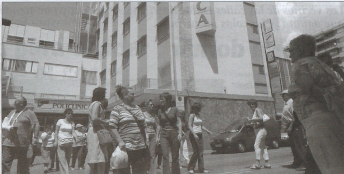
Una manifestación de los ex-trabajadores de Policlínica en la víspera de abandonar la empresa.