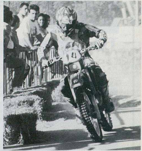
L'equip Costa Competició, tot i no poder acabar la prova, va fer un total de 660 voltes