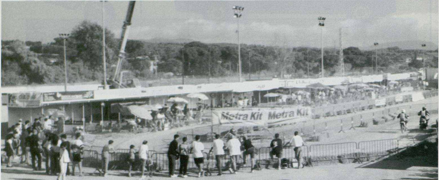
L'organització de la prova, a càrrec de la Colla del Pa amb Tomàquet, va ser, un any més, tot un èxit

L'equip Beta Trueba va aconseguir la victòria a les ja clàssiques 24 Hores de Ciclomotors de Lliçà d'Amunt, que es van celebrar el primer cap de setmana del passat mes de setembre. El conjunt de Girona va fer un total de 691 voltes a un traçat de 1.850 metres. La segona posició va ser pel conjunt Metrakit Asensio d'Igualada i la tercera per l'equip Casas Racing de Cardedeu. La classificació estava dividida en tres grups: motos de dos temps, tres temps i scooters.