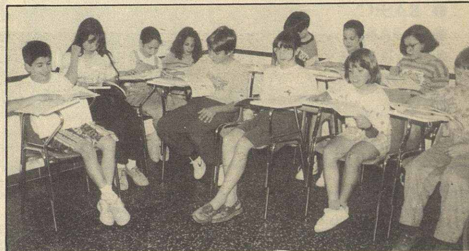
Good s'especialitza en els més joves

Una de les escoles, per als més petits, és la "Sidmouth International School" a la costa sud, on s'organitzen activitats de tot tipus i hi ha una vigilància permanent, a més de la