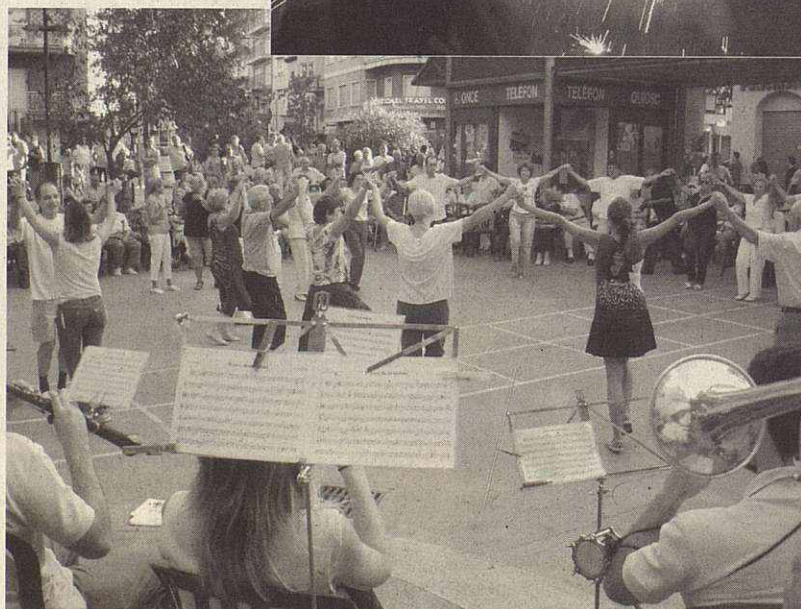
Sardanas en la plaza Catalunya