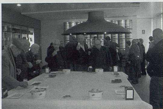
Cervesa Sant Miquel.

El passat mes de març, un grup de 30 persones vam anar cap a Lleida per visitar la Fàbrica de Cervesa Sant Miquel on acompanyats per una persona de l'empresa vam fer una visita a les instal·lacions i ens va explicar com s'elabora el producte i els seus orígens i el perquè del nom Sant Miquel. Un cop acabada aquesta interessant visita vam ser obsequiats amb una degustació de les seves diferents elaboracions i un petit obsequi com a record de la nostra visita.