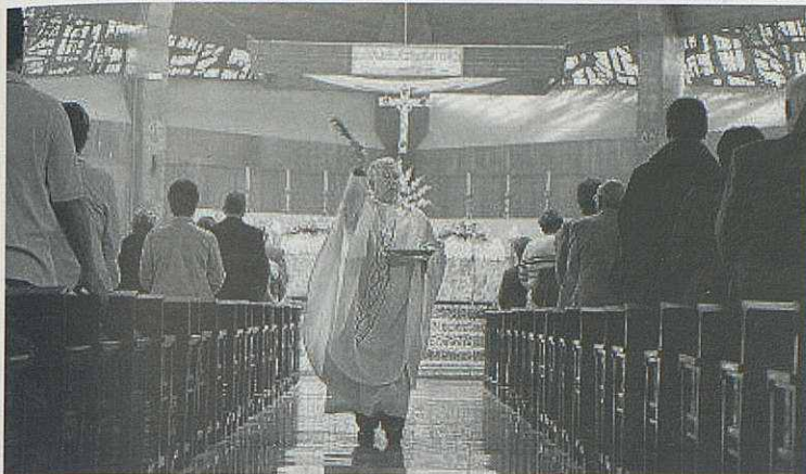
Missa a la parròquia de Sant Pere i Sant Pau (el Prat de Llobregat).

però és just reconèixer-ho, així com també el que fan altres comunitats religioses en el conjunt de la societat catalana. Sense la col·laboració gratuïta de molts feligresos, sobretot dones i, generalment, d'avançada edat, no podrien desenvolupar-se les funcions socials, formatives de la parròquia. Però l'església, com ha subratllat amb èmfasi el papa Francesc, no és una oenagé, ni està cridada a esdevenir el tapaforats, per dir-ho amb l'expressió de Dietrich Bonhoeffer, d'un sistema econòmic que mata, com s'afirma a "Evangelii gaudium". Està cridada a ser un lloc de consol, de refugi, un àmbit on sigui possible fer experiència de la infinita bondat d'un Déu que vetlla per cadascú de nosaltres fins i tot en la més obscura de les nits. No és un fi en si mateix, és un instrument al servei de quelcom que la transcendeix. Per això, la dimensió espiritual és bàsica, una dimensió que es tradueix en la celebració de l'eucaristia, en l'escolta de la Paraula de Déu que, com un do, se'ns regala cada dia, perquè a la llum d'aquesta Paraula, examinem la pròpia vida i orientem l'existència envers el Crist. És lloc de celebració en comunitat. Només això és profundament cultural en una societat caracteritzada per la fragmentació i l'hiperindividualisme (G. Lipovetsky) i per la ideologia de la rendibilitat (Chul Han) que acaba destruint el diumenge com a espai dedicat a l'oració i a la contemplació. L'homo laborans potenciat unidimensionalment per aquesta cultura del rendiment deixa pocs