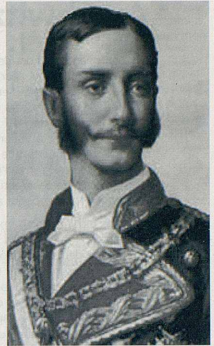
El conde de España.

El cert és que en el País Gran donen símptomes d'una certa por i estan incrementant tant com poden, les moltes i moltes repressions disfressades de recursos als tribunals, d'intentar tombar las lleis proclamades en el nostre Parlament, etc. Però jo crec que ells mateixos s'estan ficant en un atzucac del que difícilment en podran sortir i, per tant, podem seguir mantenint la confiança que en un temps més o menys proper, o llunyà, aconseguirem, per fi, ésser independents.