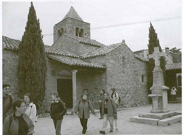
Placeta de l'Església de Romanyà de la Selva

Tot seria molt senzill sinó fossin novel·les absolutament modernes que retornen a la vida diària, però no des de la vulgaritat indiferent i esquifida, sinó des del batec de les paraules que basteixen la manera de fer de la societat catalana, des dels grans temes i també des dels detalls. Per què ens ha agradat retornar a aquest paisatge conegut? Doncs precisament per això, pel gust de trobar-hi la coneixença d'una bona amiga, dels paisatges savis i amables, dels camins que porten les paraules d'una vida, perquè som amics que ens agrada viure la vida de Catalunya des dels camins i des de les paraules. Després, vàrem passar pel petit cementiri, hi ha un bust de l'escriptora, sembla que el vent li mogui els cabells i la seva cara que pensa, amb aquella rialla entre suau i absent, plena d'una vida interior silenciosa i activa; ella que va mirar tant les