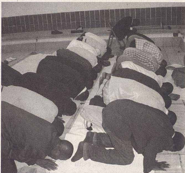
Momento de la oración mirando hacia la Meca

en radio Mollet que se emite dos jueves al mes a las 21,30 horas, aunque en próximas fechas pasará a emitirse todos los jueves. El programa se titula Djiké, que significa esperanza, un programa de música y cultura hablado mayoritariamente en Suniké. ■