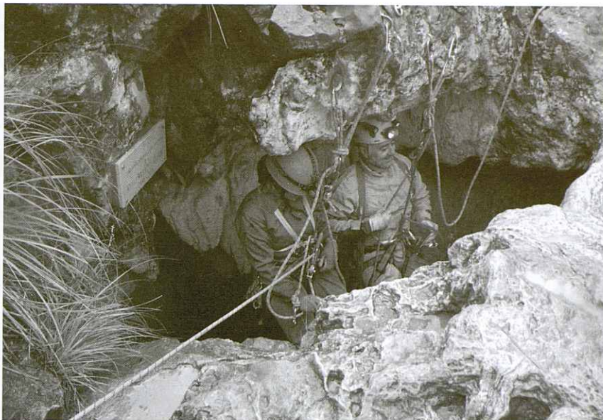
Avenc Emili Sabater.

Haig de dir que hem tingut alumnes trempats i que esperem que hagin pogut descobrir una miqueta més d'aquest món fascinant.