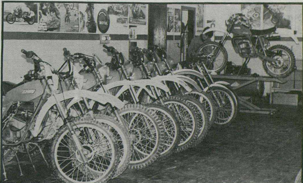
Taller de Motos Andreu, donde preparan y ponen a punto sus máquinas este grupo de corredores.

Campeonato de Cataluña: Gironella, Reus, Manresa, Girona, Solsona, Riells, Pons, Gironella, Olot y Rosas.