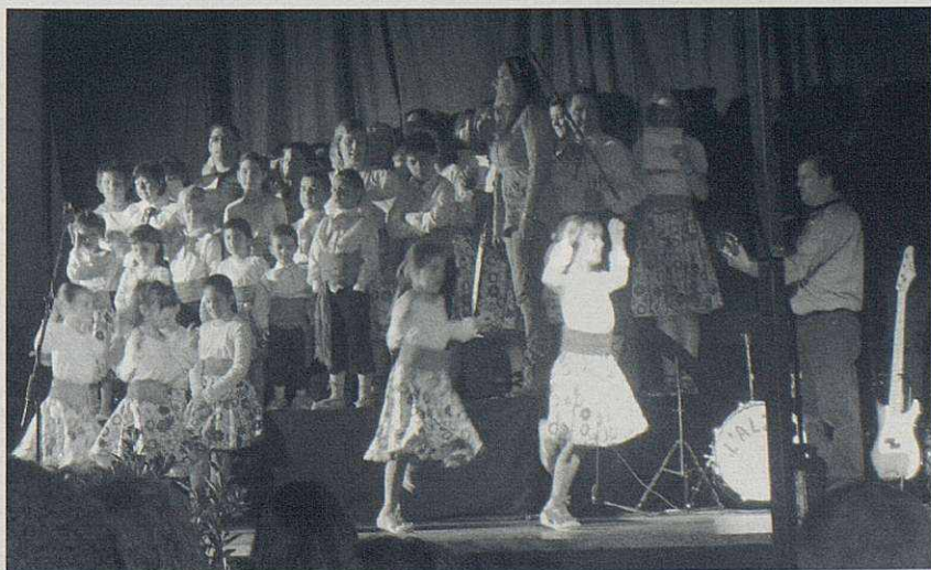
La Colla de Gitanes, una de les entitats que va actuar en la presentació del cançoner.