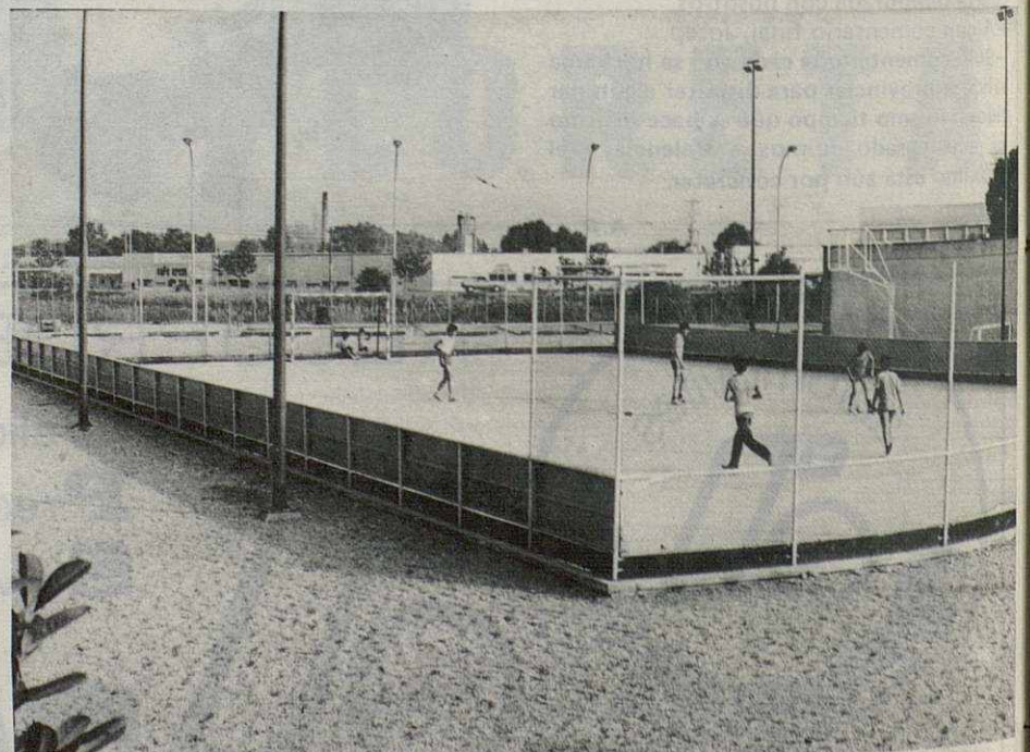
Pista Polideportiva Municipal de Lliça d'Avall, construida hace unos años y que dentro de unos meses se convertirá en Pavellón. Las obras de la estructura cubierta ya comenzaron y en Septiembre se pasará al ensamblaje de dicha estructura.