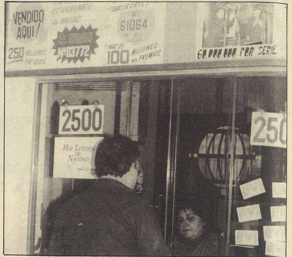
A l'any 1986 va tocar una gran "grossa" de la loteria a Mollet

La tradició de comprar loteria de Nadal sembla que va força bé ja que, tant per penyes o per comerços que venen els corresponents números, com a les mateixes administracions, la gent s'afanya a comprar-los; “no sigui que no em toqui!”, és la frase més sentida durant aquests dies. I és que fins i tot en aquest 92, els números de Nadal s'han comen-