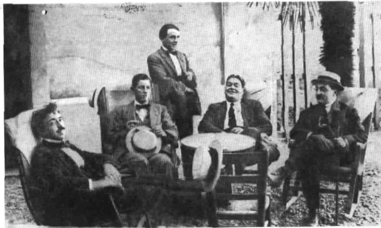
Semblen malalts i no són. Són socis del Casino una tarda d'istiu en el jardí quan hi havien aquesta mena de cadires de balneari.