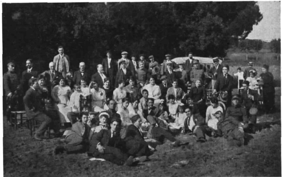
Epíleg a la Font de Can Ginesta, d'una festa de caritat i de confraternitat entre paisans i militars celebrada pel juny de l'any 1918