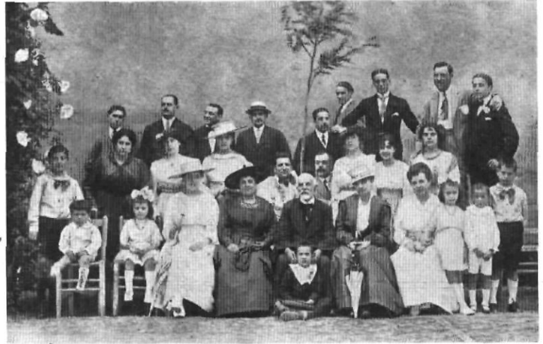
Grup d'amics de l'Avi Garrell que celebrà al jardí del Casino l'èxit del seu drama «Justícia de Déu» estrenat a La Unió Liberal pel juliol de 1917