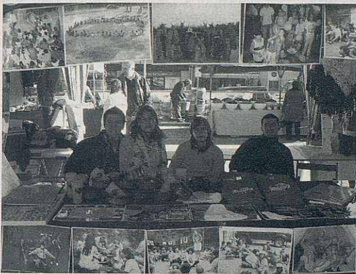
Paradeta esplaiera a la Fira d'artesans.

– El dia 10 de desembre realitzarem una paradeta-exposició a la Fira d'artesans, juntament amb altres entitats del nostre poble. Vam penjar tot un seguit de fotos de les diferents etapes de l'Esplai (des dels seus inicis fins l'actualitat). La gent que passava, encuriósida, va poder identificar-s'hi o trobar-hi altra gent amb alguns anys de menys.