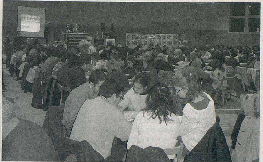
Gran Vetllada del Quinto, amb la sala gran de la Fàbrica plena de gent solidària jugant.

– El dia 11 de desembre realitzarem el 2n QUINTO. Concretament co-