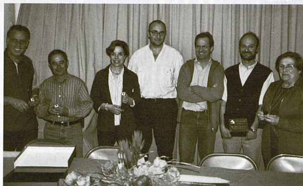
Instantània dels guardonats durant la Diada Social de l'AEG