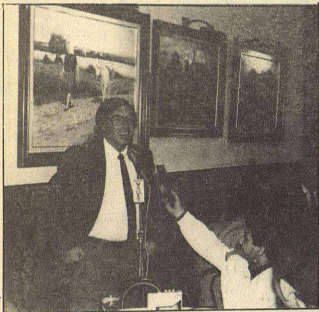
Jordi Solé Tura expuso el programa socialista en Mollet.