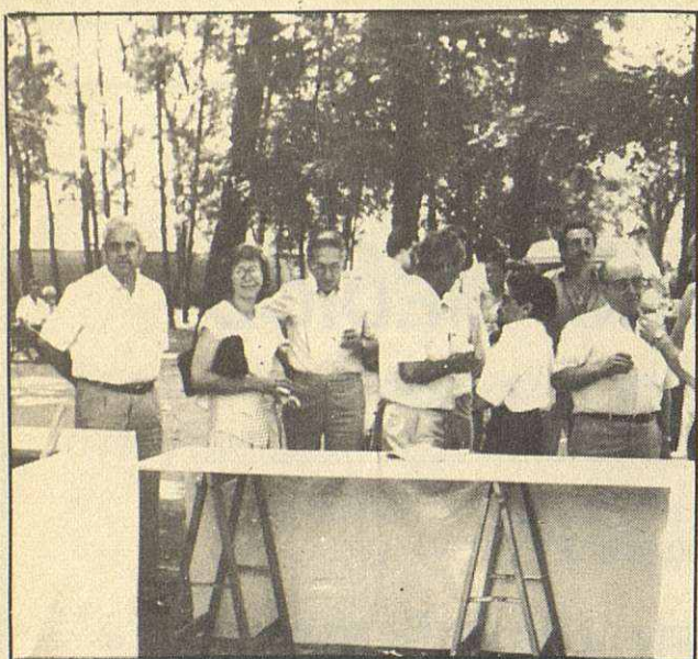
El Centro Andaluz organizó este verano varios actos. Imagen de la «fiesta del gazpacho»