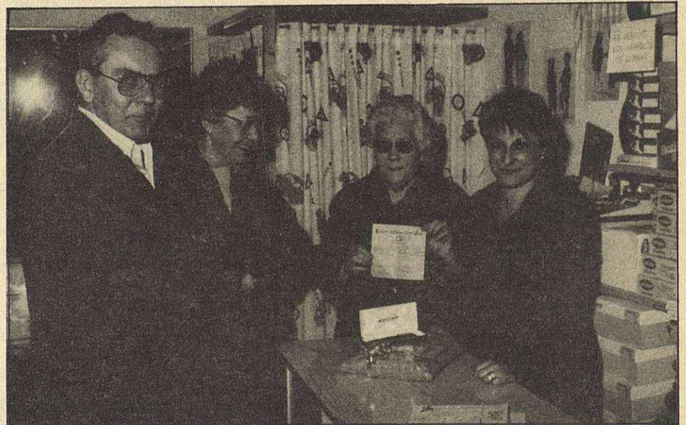
La Agrupació de Comerç i Serveis Vinzia, entregó los 50 premios del sorteo realizado el 5 de enero de 1990. El número premiado fue el 03622. En la fotografía, la ganadora recoge su premio