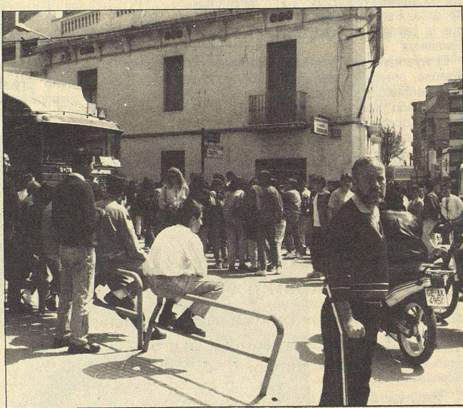
Unos cien estudiantes de BUP y FP de Mollet, cortaron el pasado día 26, el tráfico en la carretera Nacional 152, a la altura de los Quatre Camins; como medida de protesta ante la Ley de Ordenación del Sistema Educativo Español.