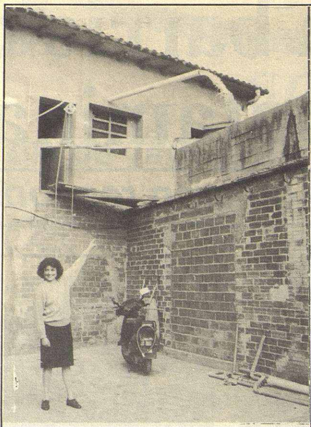
Una de las afectadas señala el agua contaminada

no se han quedado en ningún instante parados. El análisis más completo efectuado hasta el momento, lo han realizado Comlab. S. L., una prestigiosa empresa radicada en Barcelona. En este análisis, se confirma la existencia de elementos como el Plomo y disolventes orgánicos, entre los que destaca el xileno y el tolueno. Este