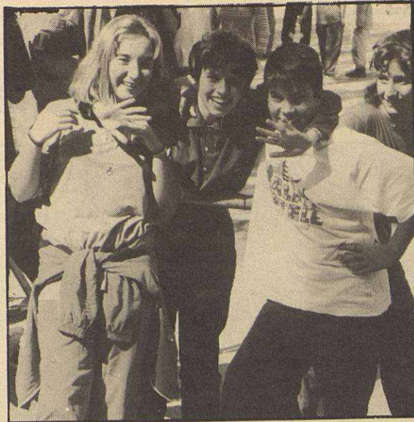
Mollet cuenta con una de las poblaciones más jóvenes de Europa

La enseñanza a los alumnos con más de 14 años es algo inferior que la educación general básica. El Instituto de Formación Profesional de Mollet, que está considerado como uno de los mejores de Catalunya, este año tiene 2.000 alumnos entre el turno de mañana y tarde, aunque hay que tener en cuenta que no todos estos alumnos son de Mollet, ya que este centro educativo recibe alumno de otras poblaciones vecinas, como pueden ser Sant Fost, Martorelles, Parets, La Llagosta, etc. En BUP y COU el número de alumnos es sensiblemente inferior. Así, el Instituto de Bachillerato cuenta con 1.300 alumnos reparti-