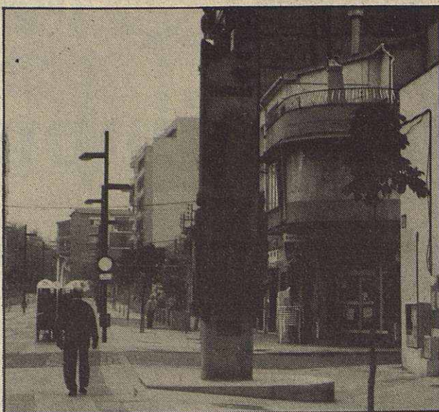
El monumento del Mil·lenari de Mollet, fue su última obra.

En 1986 hizo una escultura para la Asociación Amical Mathausen de Lyon y en 1991 hizo otra para el