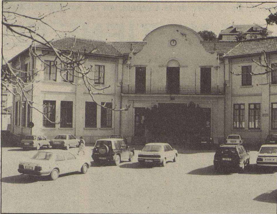
El Ayuntamiento de Sant Fost se ha visto inmerso en la polémica debido a una denuncia por corrupción