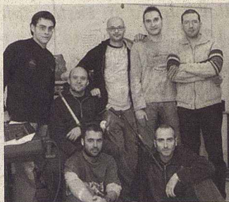
Celtas Cortos actuarán el domingo por la noche en el Parc de Can Mulà