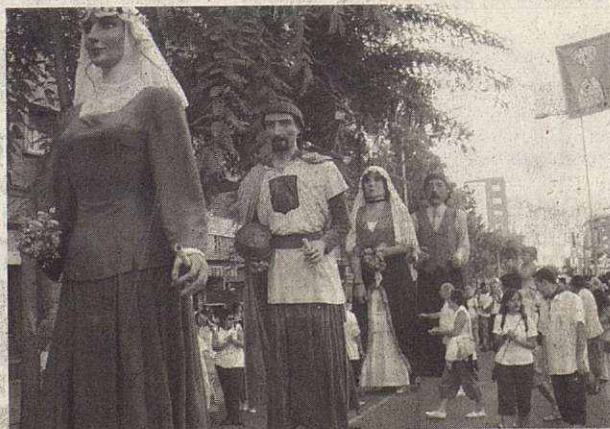
Diferentes actos celebrarán los 25 años de los gegants de Mollet