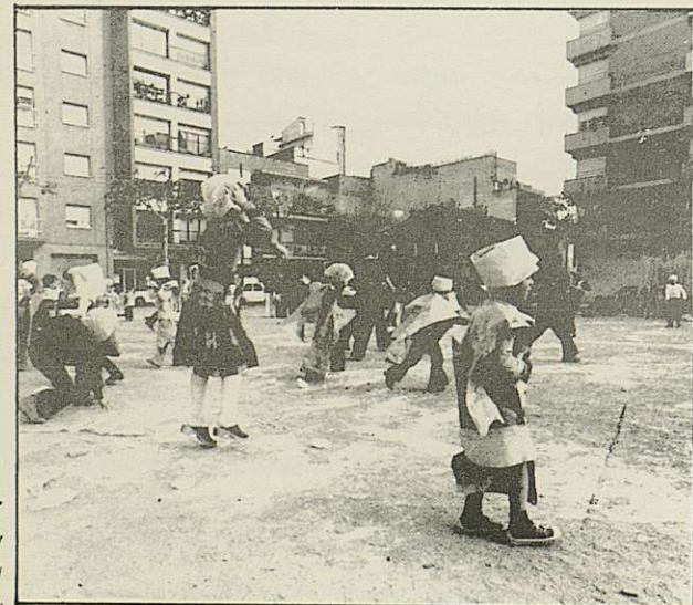
MOROS I CRISTIANS. BOMBARDES, NEUS, COLORS, PAPERES I GUIX.