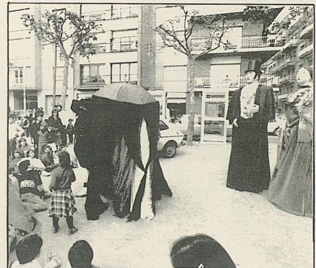
ELS GEGANTS S'HO MIREN SERIOSOS I DESDE MES AMUNT...