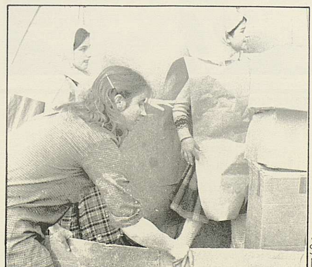
Δ ALGUNS S'ELS VA VEURE MOLT ATRAFEGATS

AGRAIM LA COL·LABORACIÓ DE LA CAIXA D'ESTALVIS DE CATALUNYA