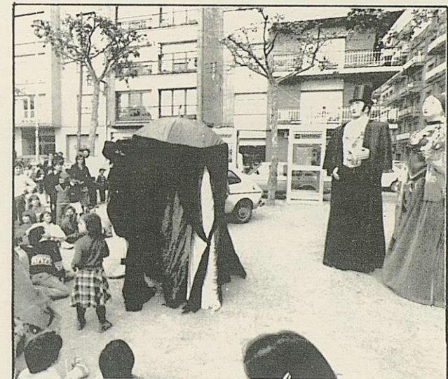
ELS GEGANTS S'HO MIREN SERIOSOS I DESDE MES AMUNT...