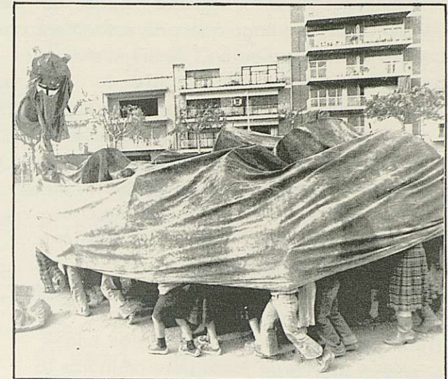
EL DRAC... QUANTES POTES DEVA TENIR ?

Vàrem voler celebrar Sant Jordi que com un "Super di com cal: amb el drac i le man" va aparèixer amb l'espasa lluites antigues de moros i cristians, i portats per l'Allà, presidint la festa, hi havia la princesa i els seus bient ens van situar a l'edifici que eren molt alts ..... mitjana, la plaça convertida en camp de batalla, tot a punt per a començar la lluita entre moros i cristians, que abans s'havien vestit molt bé i parat l'ofensiva d'atac. I d'una van començar a caure primeres bombardes. Un escamp de papers, neus, colors i guix. I el drac, que no podia fer-li fer-li pessigolles. La xocolata amb ganes de menjar-se la primera bona d'allò més i ens en cesa. Sort n'hi va haver vam fer un bon tip.