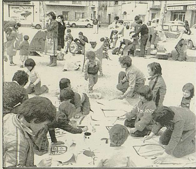
TALLER DE PINTURES PREPARANT LES CORASSES