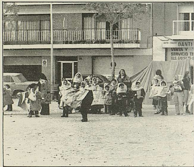
Δ PUNT PER L' ATAC