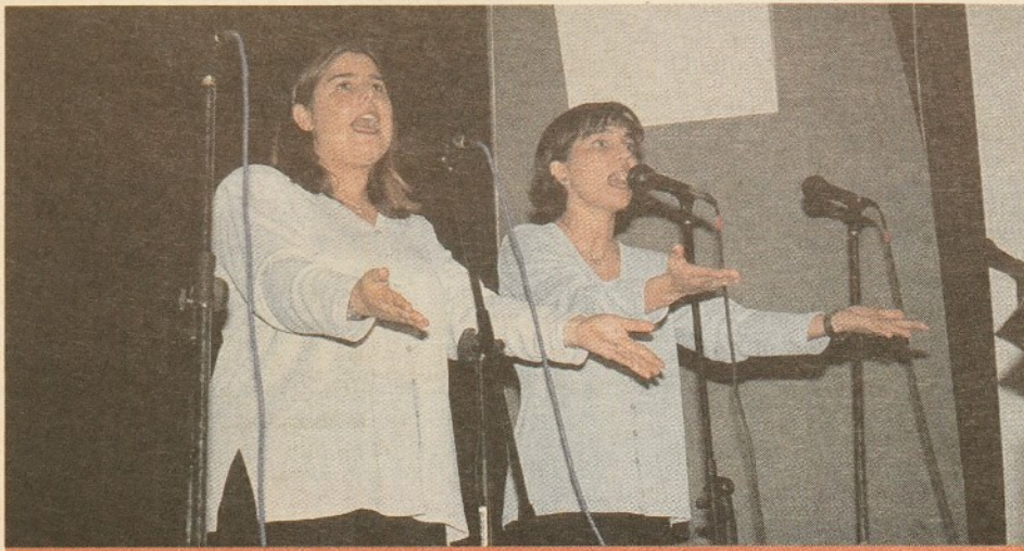
El Col·lectiu cristià l'Estel del Matí va oferir una mostra de gospel.

va marcar l'organització d'aconseguir 1.000 participants es va complir, ja que més d'un miler de persones, entre ciclistes i voluntaris, van ser al carrer per viure aquesta festa.