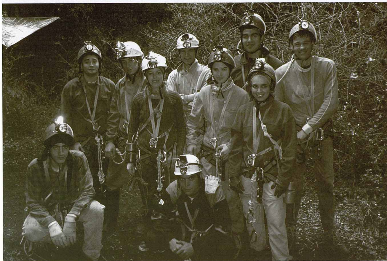
Els cursetistes a la boca de l'Avenc de la Carbonera, a Sant Llorenç del Munt

La realització d'aquest curs ha anat a càrrec de la secció d'espeleologia, GIEG, i ha tingut lloc durant el mes d'abril d'enguany. Ha comptat amb la participació de 10 alumnes, que han mostrat en tot moment predisposició i interès en l'aprenentatge de l'espeleologia.