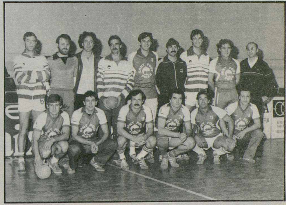
U. E. FIBER - SANT FOST

—Lo somos porque confiamos en nuestros jugadores y los vemos con más ganas que nunca para devolver el equipo a esta máxima categoría del balonmano, que jamás debimos haber perdido.