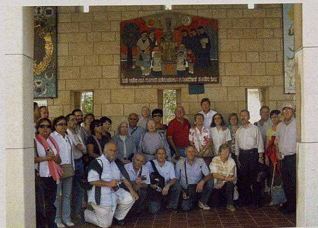
Grup de pelegrins davant la Mare de Deu de Montserrat, a la basílica de l'Anunciació de Natzaret..

A més del testimoni dels cristians que hi han viscut sense interrupció, i que avui són els cristians més pobres de la terra perquè són alhora de cultura àrab i de fe cristiana ortodoxa, o sigui que no tenen qui els ajudi ni els defensi (perquè són vistos com a àrabs renegats, o cristians no occidentals, o pobres ortodoxos). A més del d'ells, tenim el testimoni dels pelegrins, entre altres grafits: "XE MARIA", "Déu vos guard, Maria", a la base d'una columna de la més primitiva basílica que abrigà la casa de Maria, a Natzaret, passant pels escrits de la peregrina Egèria (+ 415), tot al llarg de la història, sense oblidar els testimonis del pare sant Francesc (+1226), del nostre gran Ramon Llull (+1315), de l'estimat Mn. Cinto Verdaguer (+1902), del germà universal Carles de Foucauld (+1916), del Papa Pau VI (+1978), ... Fins als nostres dies la corrua de