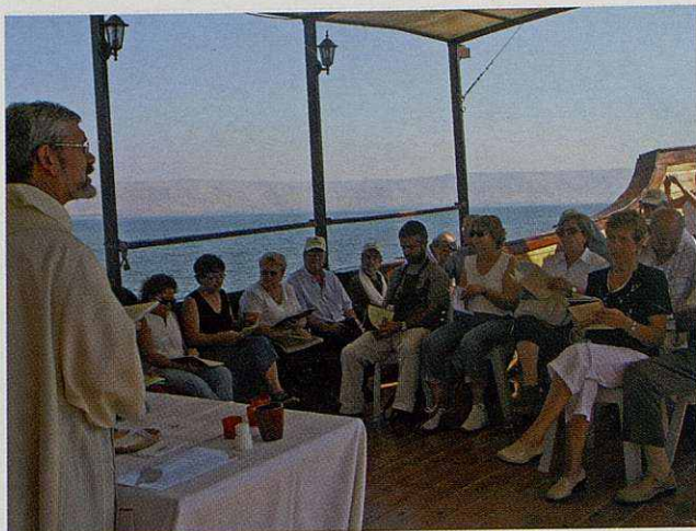
Celebració de l'Eucaristia dalt la barca, al Mar de Galilea.

Si això que dic va constituir la fe de la primera generació de cristians i ha estat la de totes les altres generacions fins a arribar a ser la fe dels cristians d'avui, entre els quals em compto, jo em deixo per anar a veure aquelles pedres, a trepitjar aquella terra, a respirar aquell aire, a contemplar aquell cel i a travessar aquell llac ... perquè no hi ha cap rastre de Jesús, el Crist, que m'interessi només una mica, tots m'interessen molt! I –sense deixar de contemplar-lo en l'Eucaristia i en la Paraula i en els Pobres– jo no podia fer altrament que anar-hi per tenir noves perspectives de la meua contemplació i per dir-vos a vosaltres del que sóc testimoni i de qui sóc seguidor.