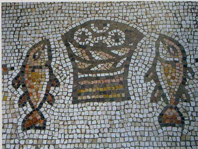
Mosaic bizantí de la multiplicació dels pans i els peixos.

Més tard, quan l'emperador Constantí amb l'edicte de Milà (313), decretà la llibertat de culte a tot l'Imperi Romà, els cristians pogueren enderrocar els temples romans i recuperaren les referències materials de la seva fe. I la història dels pelegrinatges a Terra Santa d'aleshores ençà ja no s'ha aturat.