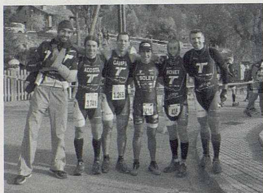
Els nostres corredors a Vallfogona del Ripollès.