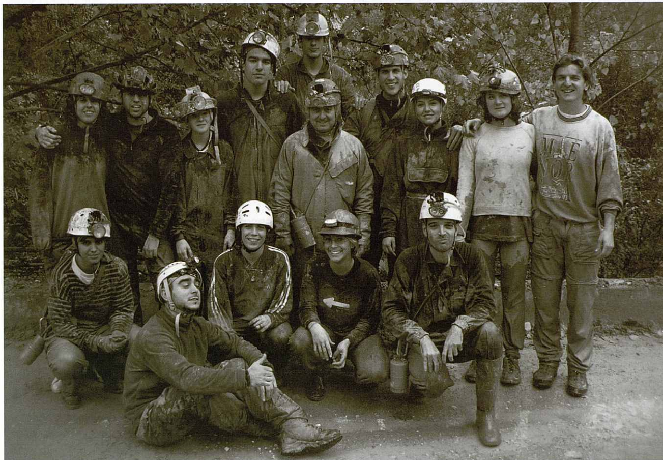
Els participants de l'excursió després de sortir a l'exterior de la cova.

El diumenge dia 23 d'octubre la secció d'espeleologia, GIEG, va portar a terme la sortida anual de portes obertes a l'espeleologia. Aquest any la cavitat escollida per explorar va ser la cova de la Mosquera que es troba situada en el terme municipal de Beuda, prop de Besalú amb gairebé un quilòmetre de recorregut, gran part amb un petit riu.