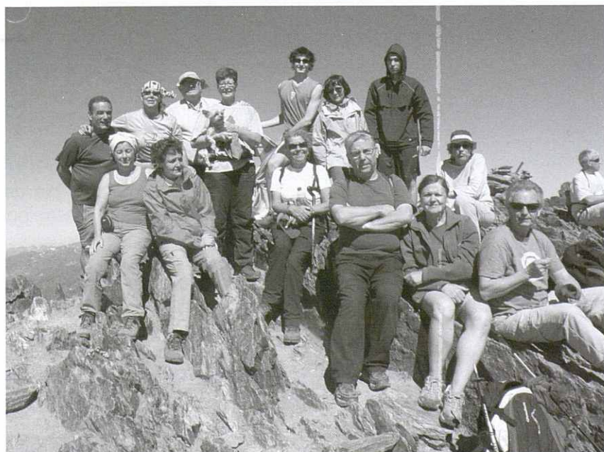
Cim del Carlit.

Comencem el camí tot seguint les indicacions que en tot moment trobem i per les quals només ens hem de deixar portar. Ens endinsem primer en un bosc de pi negre i més tard passem per diferents estanys: Negre, del Viver, de la Comassa, Sec, Vallell, Sobirà i Estanyol Glaçat del Sobirà. Aquest últim ens permet en la distància veure la cara Est del bicèfal Carlit, on ens dirigirem tot seguint els senyals. Al cap d'una estona trobem senyals vermells que indiquen la direcció correcta. Més tard aquests senyals ens indiquen per quina aresta hem d'agafar i això ens permet continuar l'ascens per unes roques trencadisses, sempre controlant els senyals i amb esforç. Finalment i després d'algunes dificultats, però amb un dia esplèndid i amb molt vent, arribem al cim. Tot l'esforç és oblidat per la bellesa del paisatge.