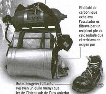
Botes lleugeres i aïllants. Pesaven un quilo menys que les de l'intent suís de l'any anterior

Sistema d'oxigen dissenyat per a l'ocasió