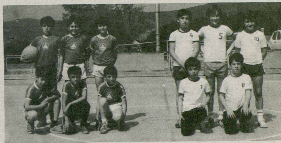
SAN LUIS GONZAGA