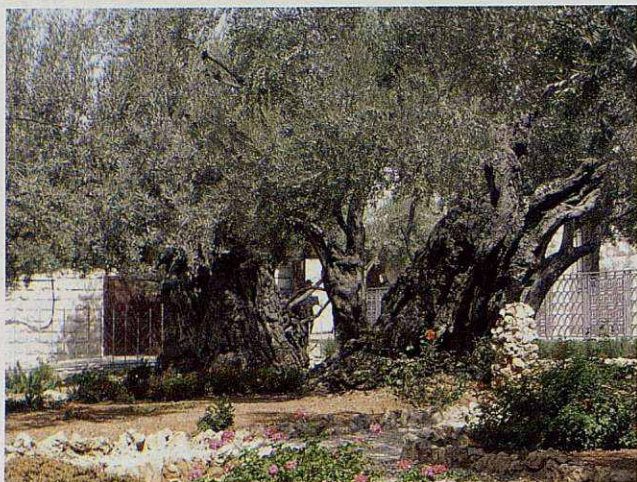
Hort de les oliveres.