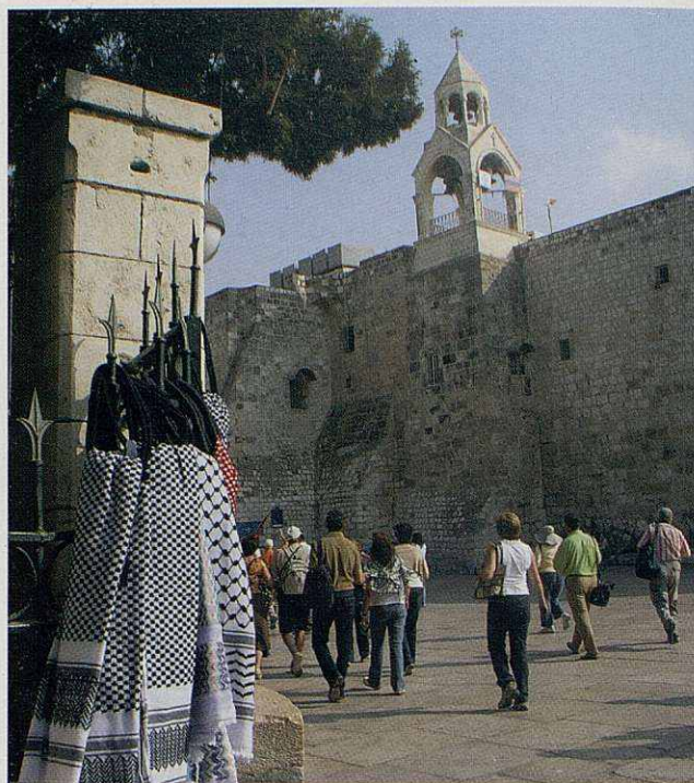
Basilica de la Nativitat, a Betlem.