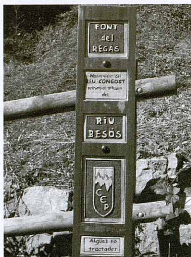
Font del Regàs, naixement del Congost.

Una vegada hem creuat, el camí s'enfila per una pista suau fins arribar a les masies de Coll d'Arnau i Boldrons. Després d' 1h. 45' de camí vam arribar a Can Regàs, on a uns 100m. hi ha una font considerada el naixement del riu Besós, per sorpresa de molts