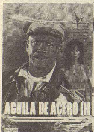
Aguila de Acero III

No se pierda los próximos estrenos en video: