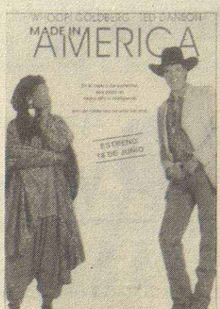
Made in América