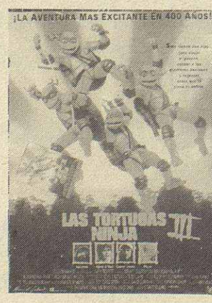
Las Tortugas Ninja III