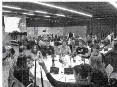
La revetlla de Sant Jordi.

Per això continuem agraint la col·laboració d'aquelles persones que, compromeses amb la vida cultural del nostre poble, ajuden de manera voluntària i generosa a desenvolupar nous projectes, i a tots aquells que ens visiten, gaudeixen de la lectura, vénen a estudiar o a endur-se llibres, pel·lícules, o música en préstec; s'hi connecten als ordinadors, o participen a les activitats... en defini-