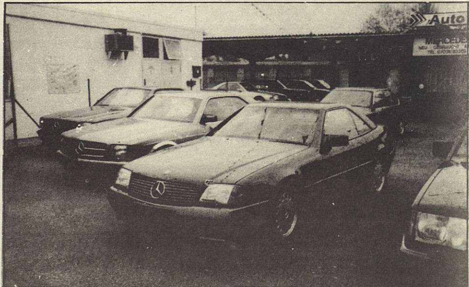
Los automóviles soñados se acercan más a usted.

Con la entrada del nuevo año se van a producir importantes novedades en lo que respecta al mercado de vehículos de importación. La desaparición de las aduanas entre los países de la Comunidad Económica Europea implica la eliminación de aranceles y de trámites aduaneros. Esto supone un importante