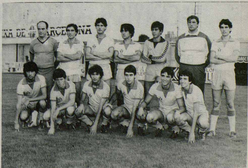
Estos son los jugadores que ha incorporado el Canovelles de cara al próximo ejercicio, pendientes aún del descarte que ha de hacer el nuevo mister Salva. La mayoría eran el año pasado juveniles.