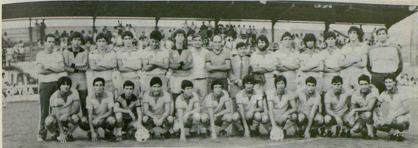
Plantilla del Canovelles para la temporada 82 - 83, con un denominador común: la gran juventud de la mayoría de sus componentes. El club vallesano no cabe duda, juega en esta ocasión la carta de la cantera.

Una nueva singladura deportiva comenzó a vivir la U. D. Canovelles, el pasado día 22 de Julio, con la presentación oficial de sus equipos para la temporada 82 - 83.